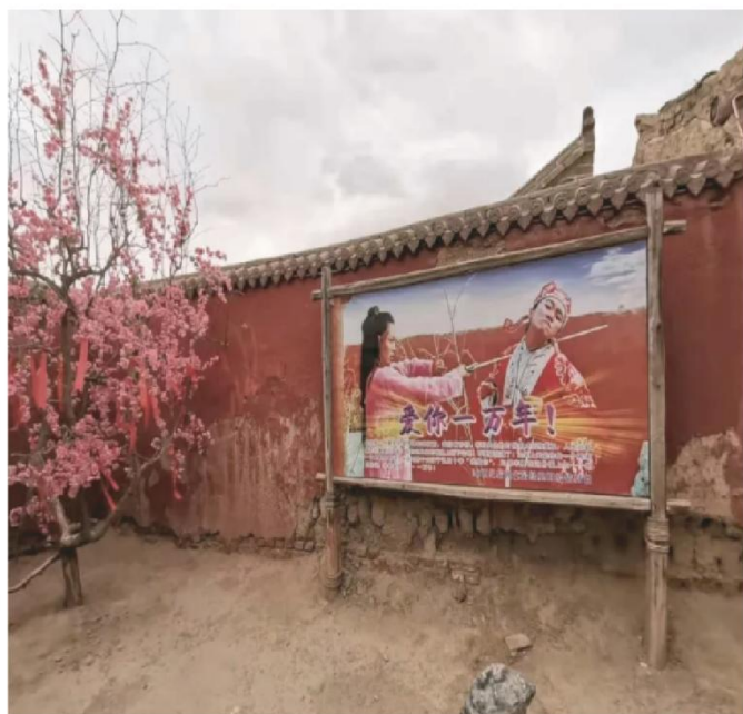
《大话西游》取景之处，是整个景区里人最多的地方