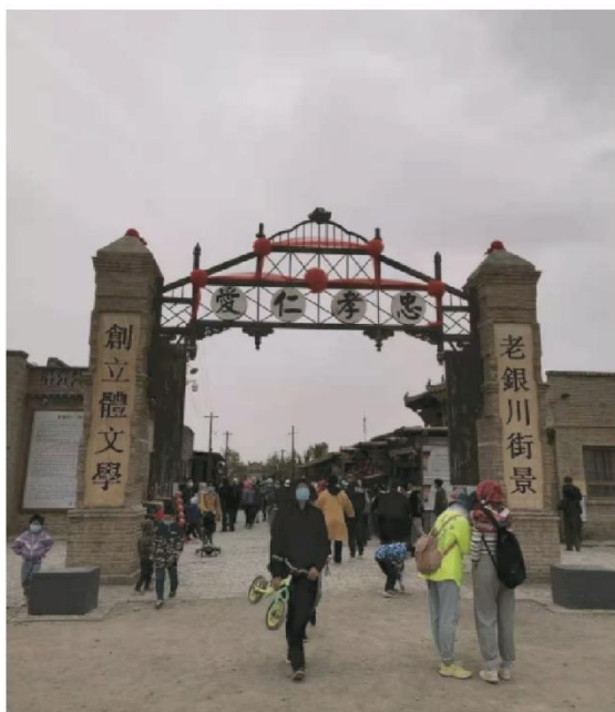
这是老银川区域门口